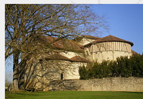
Conservation Départementale du Patrimoine et des Musées