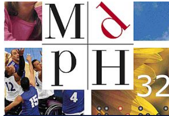
Maison Départementale des Personnes Handicapées (MDPH)