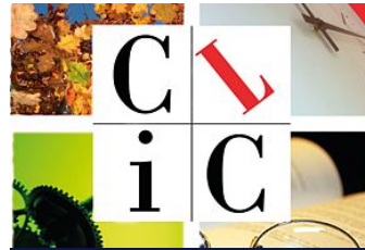
Centres Locaux d'Information et de Coordination (CLIC)