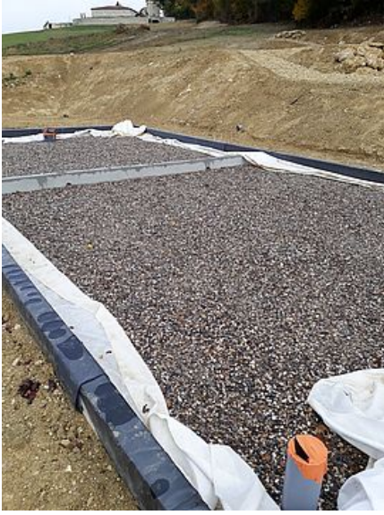
Station d'épuration de Castelnau d'Auvignon

L'Assemblée départementale a délibéré le 22 février 2019 pour un maintien de ses taux d'aides auprès des maîtres d'ouvrages en assainissement collectif, eau potable et milieux aquatiques.