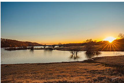
Le lac de l'Astarac

Dans le cadre de sa politique en faveur de la ressource en eau, le Département, a mobilisé plus de 11 Millions € depuis 1998 , pour les deux systèmes hydrauliques qui le concernent (Adour et Rivières de Gascogne). C'est une contribution à près de 47 Millions de m 3 de réserves en eau alimentant le territoire.