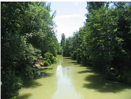
La Baise

Dans un contexte de contraintes budgétaires et de réforme territoriale, le Département a souhaité maintenir cette politique volontariste pour cet enjeu majeur.