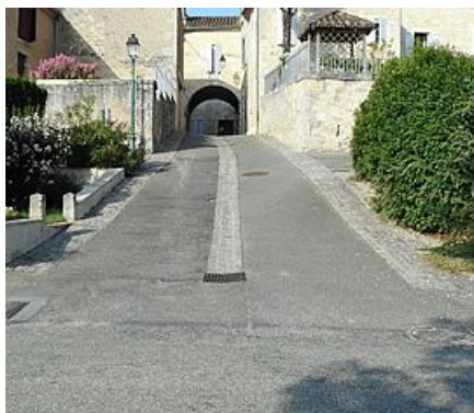
Espace public Terraube