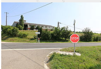
Marquage et panneaux de signalisation