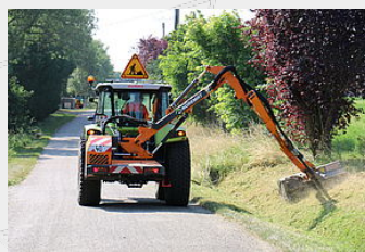
Paysages routiers et dépendances vertes