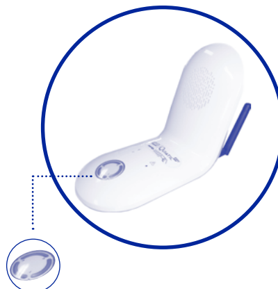
Touche d'appel d'urgence vers la Centrale d'écoute de Téléassistance