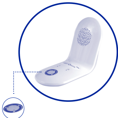
Touche d'appel d'urgence vers la Centrale d'écoute de Téléassistance