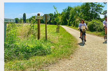
Vélo-route Vallée de la Baïse