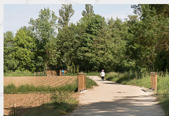
La Baïse, une rivière et... un sentier !