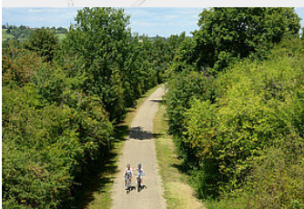
La voie verte d'Armagnac