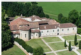
Armagnac Abbaye et Cités