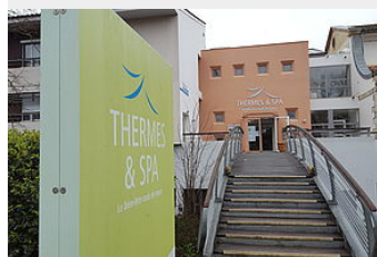
Centre thermal de Castéra- Verduzan