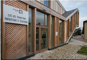
Cité des Transitions Énergétique et Écologique (CIT2E)

Engagé dans une démarche volontariste de développement durable (le Gers, 1er département rural labellisé « Agenda 21 France », dès 2008), le Département assure une promotion active des Transitions énergétiques et agro-écologiques sur son territoire.