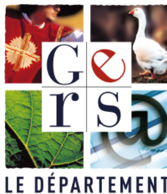
Logo du Département du Gers

Une validation obligatoire de la Direction de la Communication du Conseil départemental du Gers est requise avant la mise en impression ou en ligne du document comportant le logo, à l'adresse suivante : AMERLIN@gers.fr